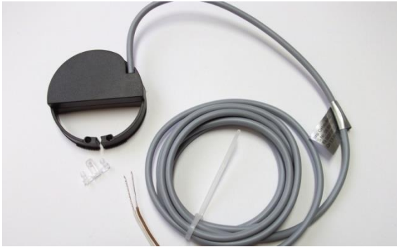
Lichtschranke (Impulsgeber) IMN-02