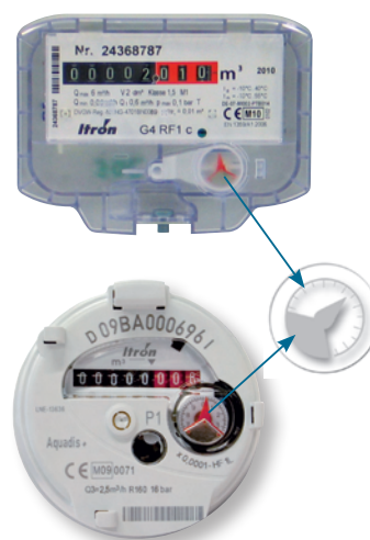
Itron Wasserzähler Zählwerk mit Cyble Target