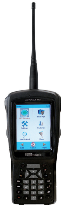
AnyQuest Handheld Terminal

Weitere Informationen zu den Funksystemen entnehmen Sie bitte den gesonderten Datenblättern und Preislisten.