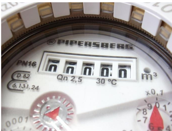
Kunststoff-Kennzeichnungsring mit untenliegendem Zahnring (Impulsgeberausrichtung)